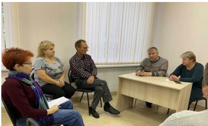
Занятие-консультация с группой соискателей будущего места работы.