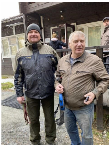
Изучение маршрута и сопровождение инвалида по зрению до места работы.