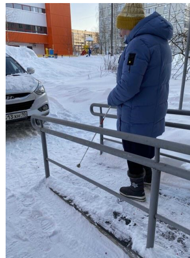
Изучение маршрута и сопровождение инвалида по зрению до места работы.