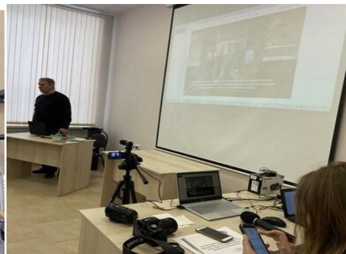
проф. ориентационной работе и решения вопросов юдей с ограничениями здоровья.