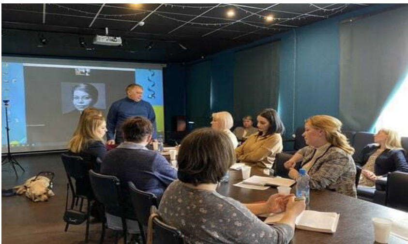
Встреча-консультация учредителей "Гармонии" с представителями организаций, предлагающих квотированные места для инвалидов.