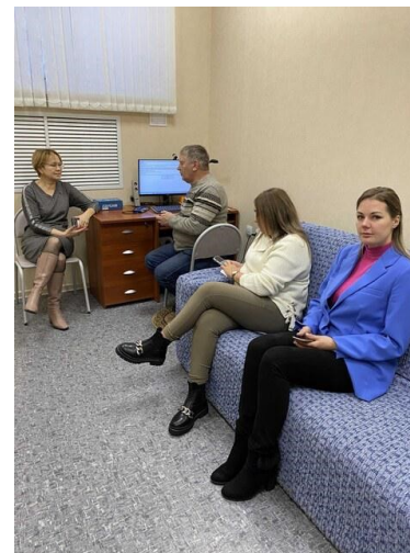
Общение с работодателями о рабочих местах для инвалидов и качественного трудоустройства людей с ОВЗ.