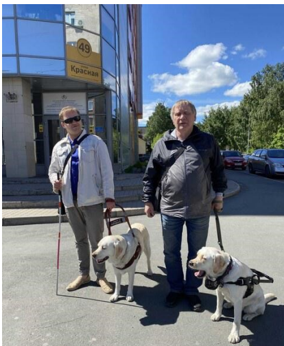
Изучение маршрута и сопровождение инвалида по зрению до места работы.