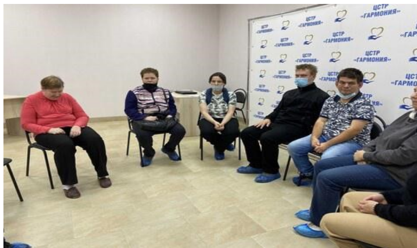
Занятие-консультация с группой соискателей будущего места работы.