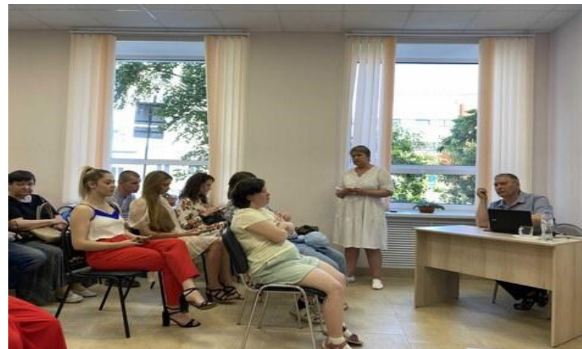
Ведущий специалист по делам инвалидов Управления труда и занятости РК дает оценку проекту .