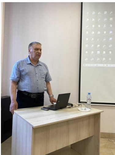
Учредитель "Гармонии" открывает семинар по подведению итогов реализации проекта "Ступени роста".