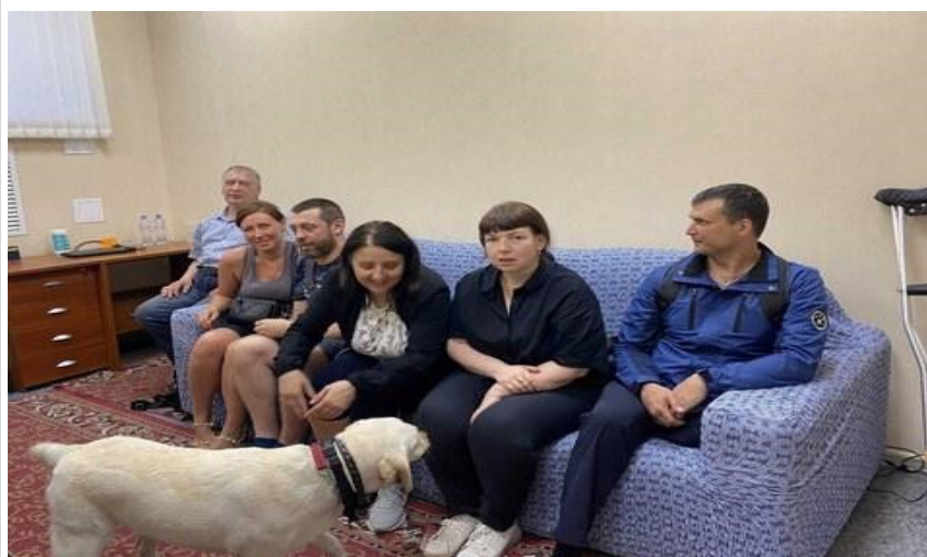
Учебные занятия по Занятие-консультация с группой соискателей будущего места работы. трудоустройства л