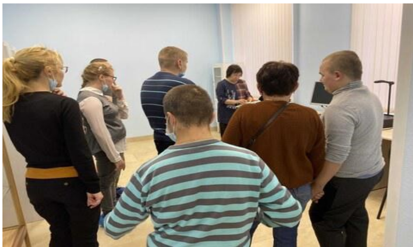
Теоретическое занятие по проф.ориентации на базе кабинета с группой соискателей места работы.