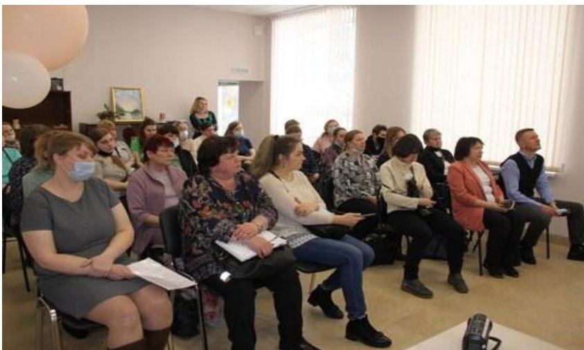
Учебные занятия по проф. ориентационной работе и решения вопросов трудоустройства людей с ограничениями здоровья, в т. ч. студентов с инвалидностью.