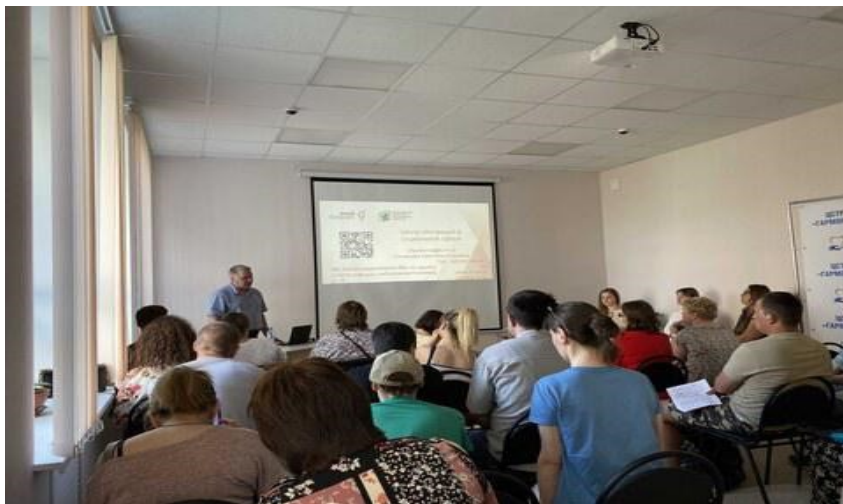
Предоставление слова Корпорации развития Республики Карелия.