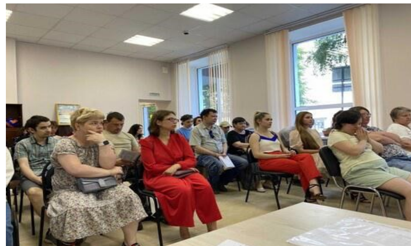
Участники заключительного семинара.

Электронные ссылки на публикации и (или) материалы, содержащие информацию о мероприятии в средствах массовой информации и сети «Интернет»