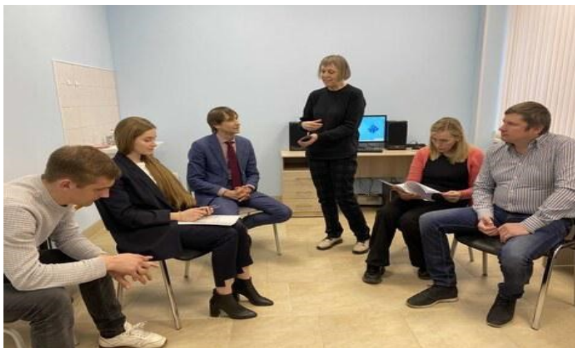
Встреча инвалида по зрению с работодателями.